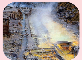
湯の花を採取する湯川