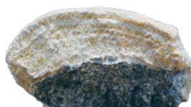
特別天然記念物：北投石