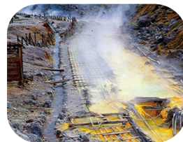
湯の花を採取する湯川