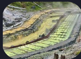
湯の花を採取する湯川