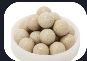
湯の花セラミック

ローズクォーツ：「出会い」「ロマンス」「浄化」「癒し」「守護」…愛と癒しをもたらす、恋愛成就の石