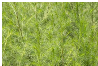
カワラヨモギ花エキス(※)