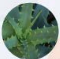
アロエベラ葉エキス(※)