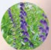
オウゴン根エキス(※)