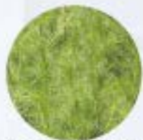
カワラヨモギ花エキス(※)