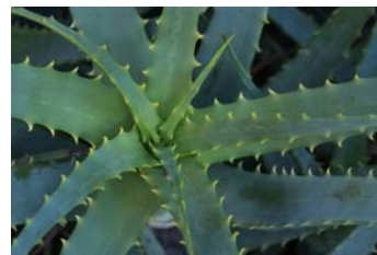
アロエベラ葉エキス(※)