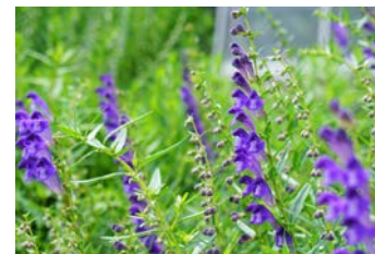
オウゴン根エキス(※)