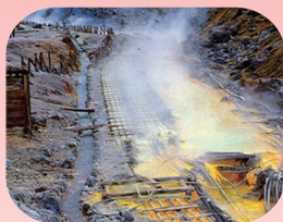
湯の花を採取する湯川