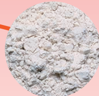
湯の花を精製した 湯の花パウダー

数々の効能から「奇跡の湯」とも称される秋田の秘湯玉川温泉。その効能の秘密は放射性ラジウムを含む北投石にあると言われていたのですが、北投石は国の特別天然記念物であり、採取は不可能です。しかし、その組成、生成の過程を調べると、北投石とは玉川温泉の湯の花が堆積したものであり、測定の結果、採取可能な湯の花も、北投石と同等レベルでラジウムを放射していることがわかりました。ラジウム系(ラドン・トリウム)鉱石を使用した温泉は、神経痛や冷え症の緩和、体質改善に優れた効果を感じる方が特に多いようです。そこで、玉川温泉の湯の花から不純物を取り除き、北投石を約95%まで再現した人工北投石を精製してパウダーにしたものが「湯の花パウダー」です。