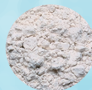
湯の花を精製した湯の花パウダー

遠赤外線パウダー配合。遠赤外線は、太陽光線に含まれる『電磁波』の一種ですが、「物質を温める体に良い電磁波」です。太陽を温かいと感じるのも遠赤外線の効果です。これを「輻射熱」(ふくしゃねつ)といいます。輻射熱で身体を温めると、身体の内部まで温まり、一度温まると冷えにくい特長があります。