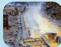
湯の花を採取する湯川

秋田県玉川温泉の「湯の花」を特殊加工した「湯の花パウダー」を配合。玉川温泉の湯の花は、薬石として世界でも有名な「北投石」を構成する成分で微量の放射線を放出しています。湯川で採取した湯の花を特殊製法で精製したものが湯の花パウダーです。湯の花は玉川温泉のものだけを使用しています。