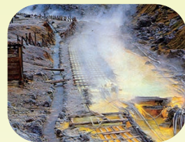
湯の花を採取する湯川