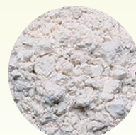
湯の花を精製した湯の花パウダー