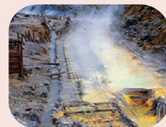
湯の花を採取する湯川

テラヘルツ鉱石から出ていると言われる「テラヘルツ波」(1THz)は1秒間に1兆回(1兆=テラ)ほどの分子振動をしています。この波長はさまざまな物質を貫通し、熱伝導率が非常に高いことも分かっています。そのテラヘルツ鉱石をパウダー状にしたテラヘルツパウダーを配合しています。