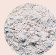
湯の花を精製した湯の花パウダー

マイナスイオンはパウダー配合。マイナスイオンには血液を浄化して弱アルカリ性にする働き、新陳代謝や筋肉の働きを活性化させる働き他、自律神経の調節を促す効果や、抵抗力・免疫力をアップさせる効果があるといわれています。