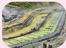
湯の花を採取する湯川