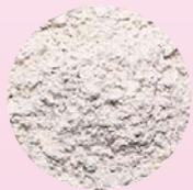
湯の花を精製した 湯の花パウダー