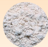
湯の花を精製した湯の花パウダー