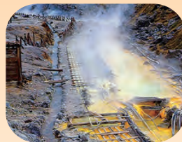
湯の花を採取する湯川