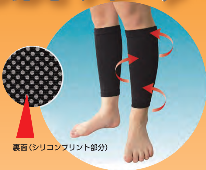
裏面(シリコンプリント部分)

足のむくみ・立ち仕事・車の運転など同じ姿勢の生活が多い方、運動不足の方にご使用いただきたい製品です。