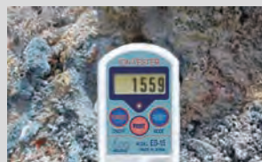
岩盤浴発祥の地「玉川温泉」