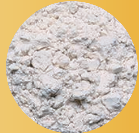
精製した湯の花 （湯の花パウダー）