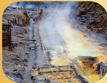
湯の花の採取場（湯川）

主組成は重晶石と硫酸鉛鉱で、その中に放射性元素であるラジウムなどを含む放射性鉱物。