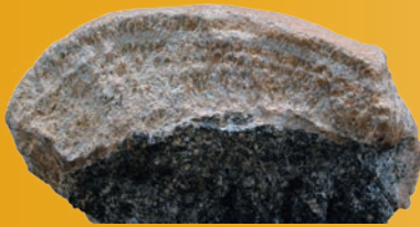
特別天然記念物 北投石

無色透明、pH1.2と極めて酸性が強く源泉温度98度。泉質は主成分の塩酸に微量のラジウム放射線が含まれている。